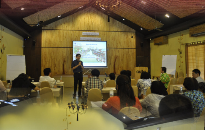
▼ สัมมนาสภาคณาจารย์ เรื่อง "บทบาทสภาคณาจารย์กับการบริหารมหาวิทยาลัย"